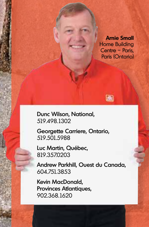
Arnie Small Home Building Centre - Paris, Paris (Ontario)